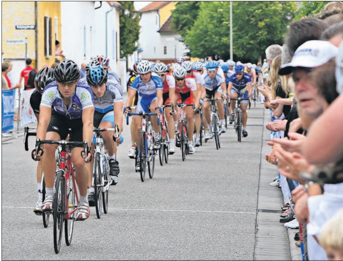
Viele Ausfälle: Nur knapp über die Hälfte der Fahrer erreichte am Ende das Ziel.